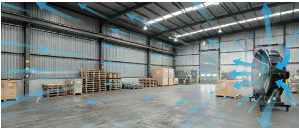
Imagen de referencia de flujo de aire.