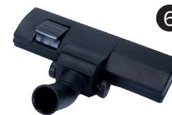
Cepillo para alfombra y suelos